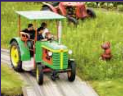
Für die Kleinen ein besonderes Erlebnis: Eine Fahrt mit dem Traktor vorbei an vielen bekannten Märchenszenen