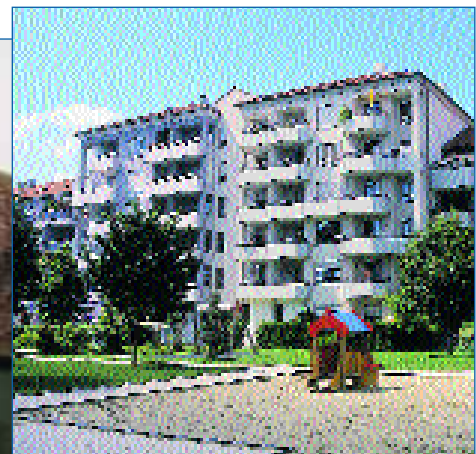
Allein in Neubauten investierte die ARGE im vergangenen Jahr rund 15 Millionen Euro