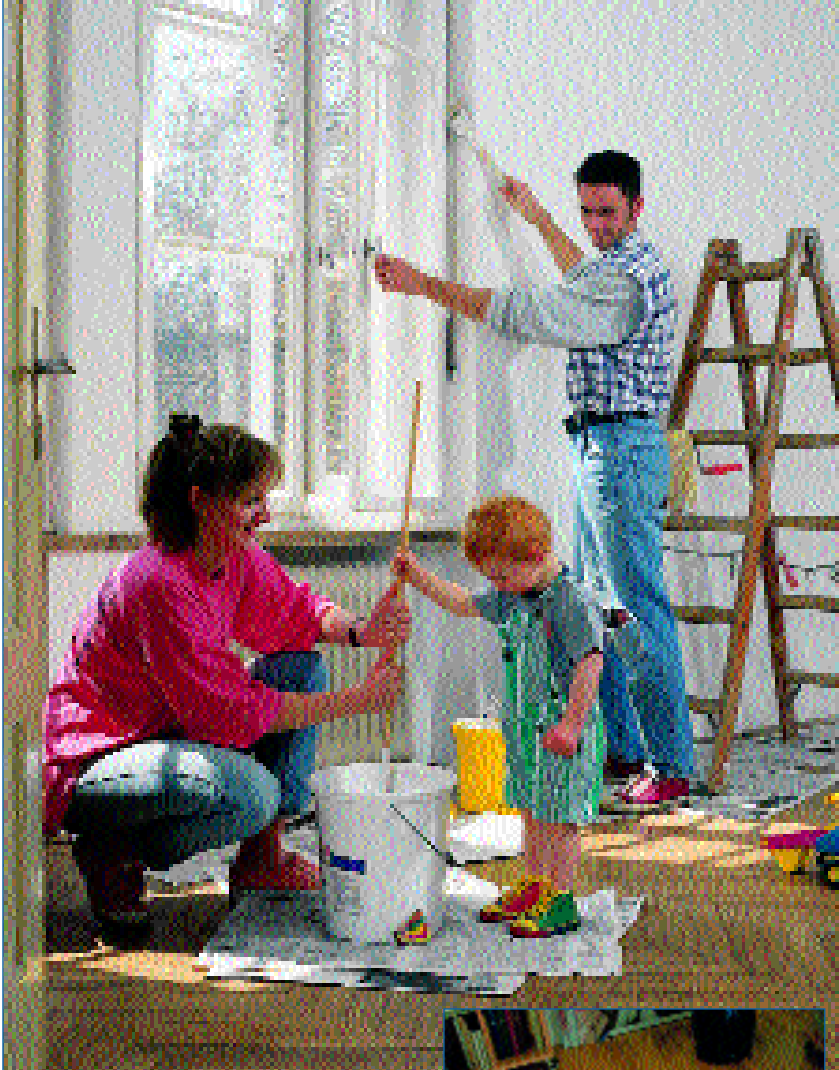
Moderne oder modernisierte Wohnungen und stabile, günstige Mieten – Wohnen bei den Oberhausener Wohnungsgenossenschaften hat viele Pluspunkte

Gerade die Mietsicherheit und die Gewissheit, dass der Vermieter nicht plötzlich wegen Eigenbedarfs kündigt, macht das Wohnen hier zusätzlich attraktiv.