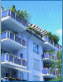
Attraktives Wohnen mit Sicherheit bieten die Wohnungsgenossenschaften

Der Wohnungsmarkt entspannt sich, dennoch sind günstige Wohnungen mit Mietsicherheit nicht selbstverständlich.