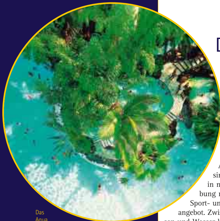
Das Aqua Mundo, die tolle Badelandschaft, ist das Kernstück jedes Center Parcs. Hier kann man bei jedem Wetter entspannen