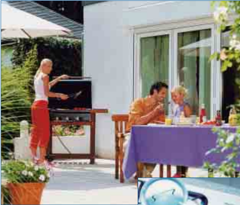
Ob Grillspaß auf der Terrasse oder flexible Aufstellung des Gasherds in der Küche: Die Gassteckdose bietet viele Vorteile