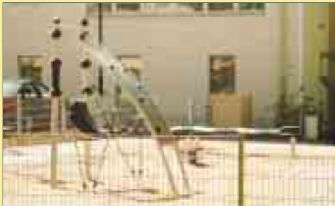
Spielplatz für Kinder in der Osterfelder Bergstraße