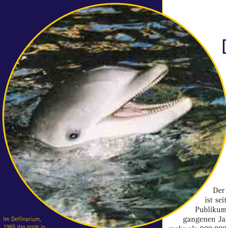
Im Delfinarium, 1965 das erste in Europa, fühlen sich die großen Tümmler wie zu Hause