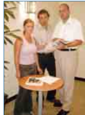
Technischer Service und Beratung in allen Vertragsfragen gehören bei der GE-WO dazu

reibungslos. Mitglied der GE-WO wird man, indem man Anteile erwirbt. Man füllt einen Bewerbungsbogen mit seinem Wohnungswunsch aus – und dieser Wunsch wird ohne allzu lange Wartezeit wahr.