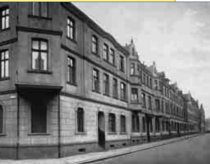
Wo alles anfang ... Eines seiner ersten Projekte realisierte der Spar- und Bauverein zu Osterfeld in Westfalen 1904/05 an der Greenstraße