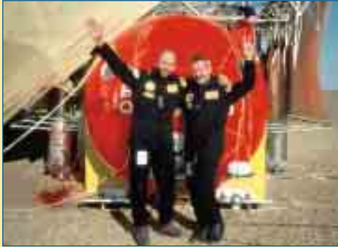
Erfolgreiches Duo: Bertrand Piccard und Brian Jones umrundeten die Welt in nur 19 Tagen in einem Ballon