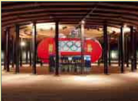
Das Abenteuer der ersten Nonstop-Erdumkreisung zeigt der Gasometer auf drei Ebenen