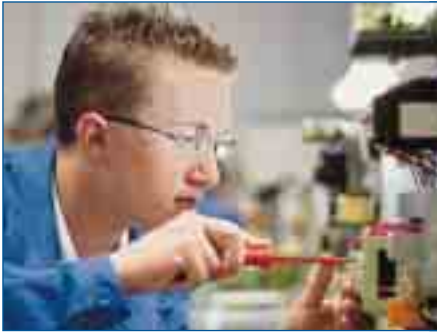
Steuern und regeln – Mechatroniker und Elektroniker schauen hinter die Kulissen