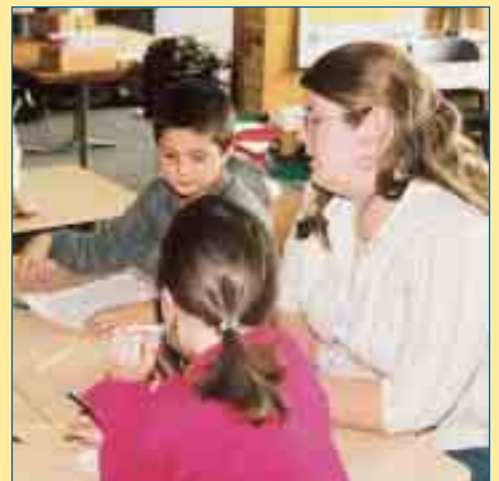
„Sag's auf Deutsch!“ Beim Ausfüllen der Arbeitsblätter werden die Sprachkenntnisse spielerisch vertieft