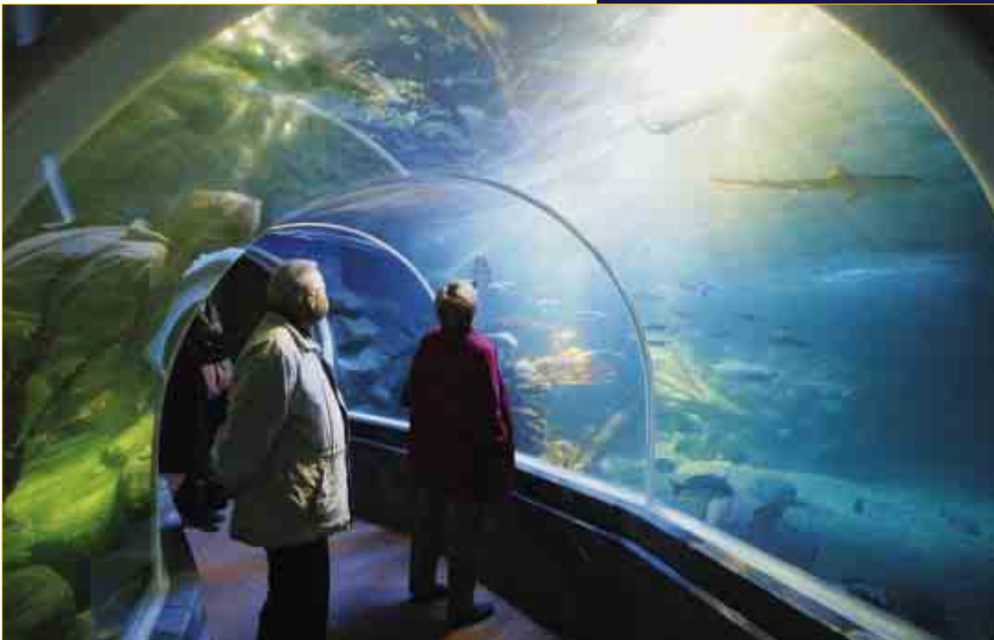
Unten: 20.000 Bewohner des nassen Elements tummeln sich in den Becken