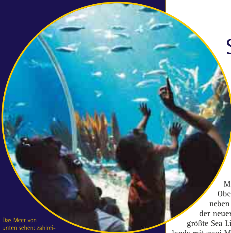
Das Meer von unten sehen: zahlreiche Fischarten bevölkern das Sea Life in Oberhausen