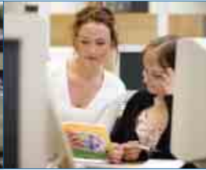
Teil der Bürokommunikation: Zahlen erfassen, Ergebnisse berechnen, Daten präsentieren

Fall, wenn seine Schützlinge überschaubare Aufgaben regelmäßig selbstständig erledigen können.