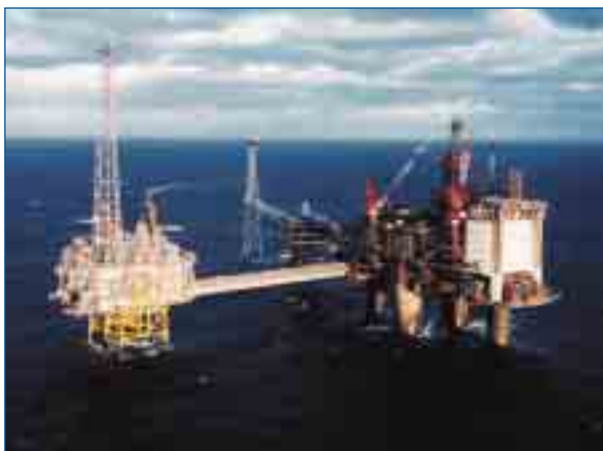
Die Ölpreise sind an den Rohstoffbörsen seit Monaten auf Rekordfahrt

Die Kunden der EVO können jedoch darauf vertrauen, dass das Unternehmen sein effizientes Beschaffungssystem nutzen wird, damit der Strompreis auch künftig zu den günstigsten in der Region zählt.