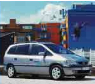
Familienfreundlich und gut für die Umwelt: der Opel Zafira

preis von 47 Cent. Mit Erdgas schont man daher nicht nur die Umwelt, sondern auch die Haushaltskasse.