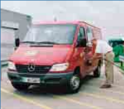
Auch viele Nutzfahrzeuge gibt es in Serie mit dem sparsamen Kraftstoff