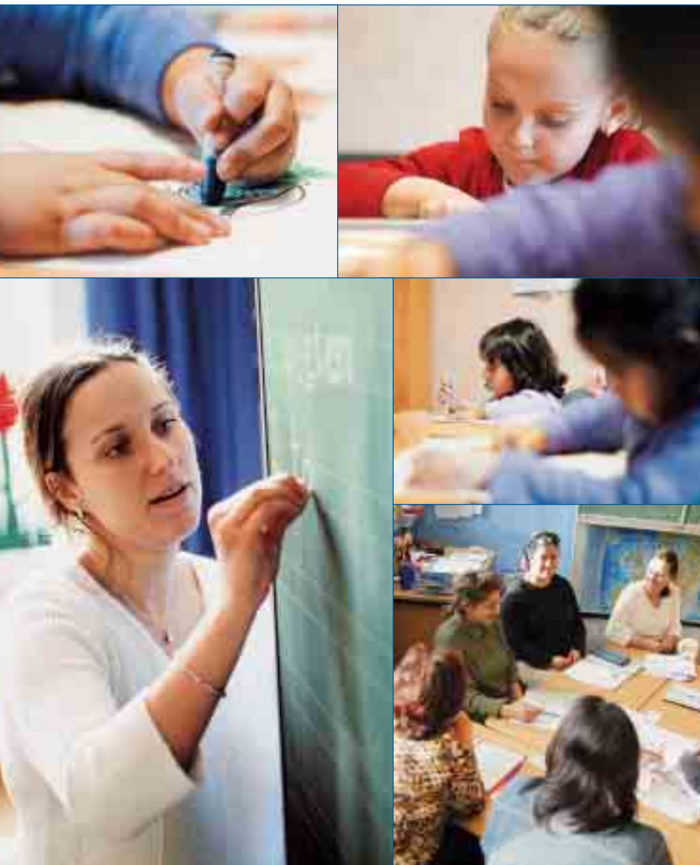
Lernen, Spiel und Spaß – vom Schulprojekt der Rotary-Stiftung profitieren alle

„Früher habe ich immer gedacht, die Deutschen sind kaltherzig. Aber seit ich mich ein wenig unterhalten kann, stelle ich fest, das dass gar nicht so ist“, sagt eine der Frauen.