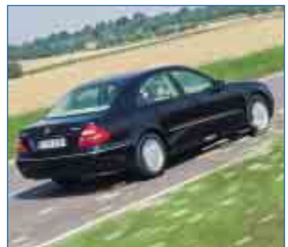
Opel Astra, Ford Focus, VW Golf – oder auch die E-Klasse von Mercedes fahren in Serie mit Erdgas

Ein Kilogramm Erdgas entspricht etwa dem Kraftstoffgehalt von 1,5 Litern Benzin. Der durchschnittliche Kilogrammpreis von Erdgas beträgt rund 70 Cent. Umgerechnet auf einen Liter Benzin ergibt sich dadurch ein vergleichbarer Erdgas-