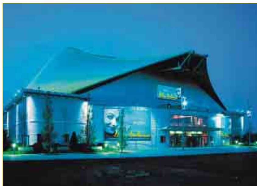
Unter dem 30 Meter hohen Dach des TheatrO CentrO findet „blue balance“ eine ideale Spielstätte. Wie im Amphitheater sind die Zuschauer mitten im Geschehen