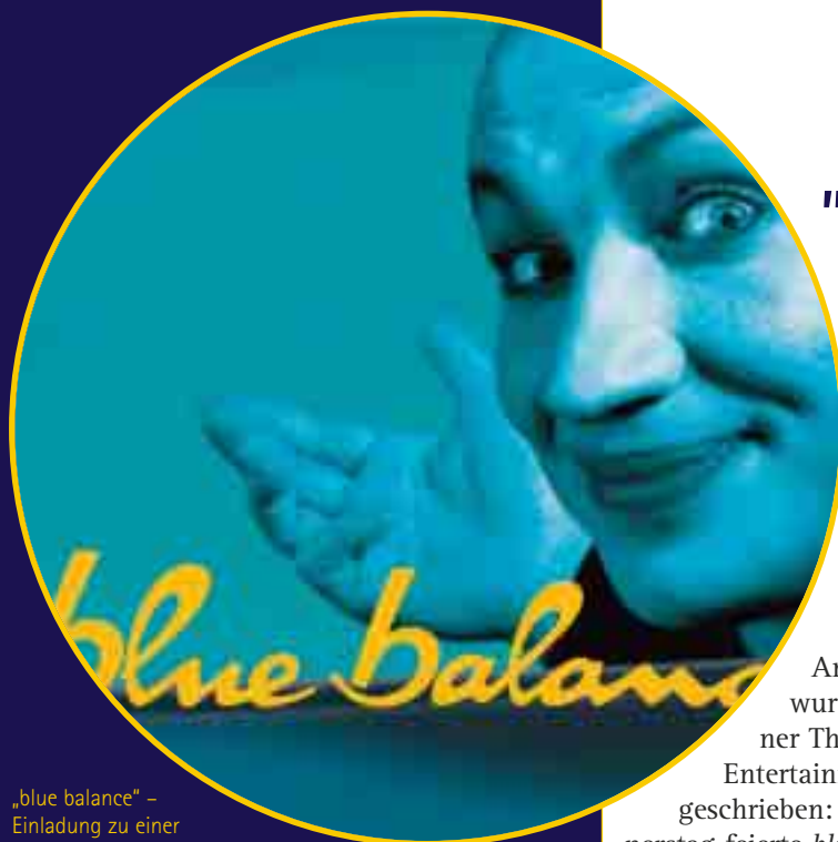
„blue balance“ – Einladung zu einer Artistik-Show der Extra- klasse mit Zirkus, Theater und Varieté