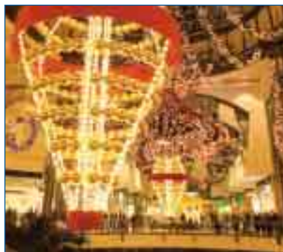
Festliche Dekoration sorgt für Weihnachtsstimmung im CentrO

Seit 14 Tagen erstrahlt das CentrO in weihnachtlichem Glanz. Beim Einschalten half Jörg Kachelmann. Seit Mitte November verzaubern prächtige Lichterketten und wunderschöne Weihnachtsdekorationen das CentrO. Rund 350.000 bunte Lichter, unzählige Tannengirlanden und Kugeln sorgen für weihnachtliche Stimmung. Auf der Promenade bietet der Weihnachtsmarkt mit 140 Hütten zahlreiche Anregungen für Geschenkideen.